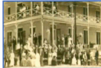
③スピリチュアリズム コミュニティ