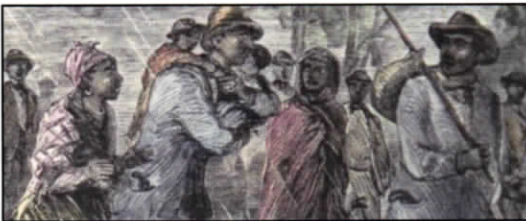
⑤ナイアガラ フォールズ地下鉄道遺産センター