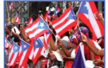
④プエルトリコ文化